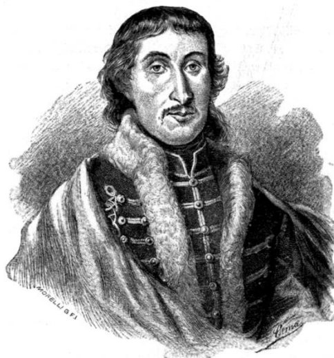
Csokonai Vitéz Mihály